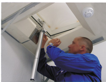
Die Montage und Wartung von Rauch- und Wärmeabzugsanlagen ist weder in Verordnungen, noch normativ geregelt.